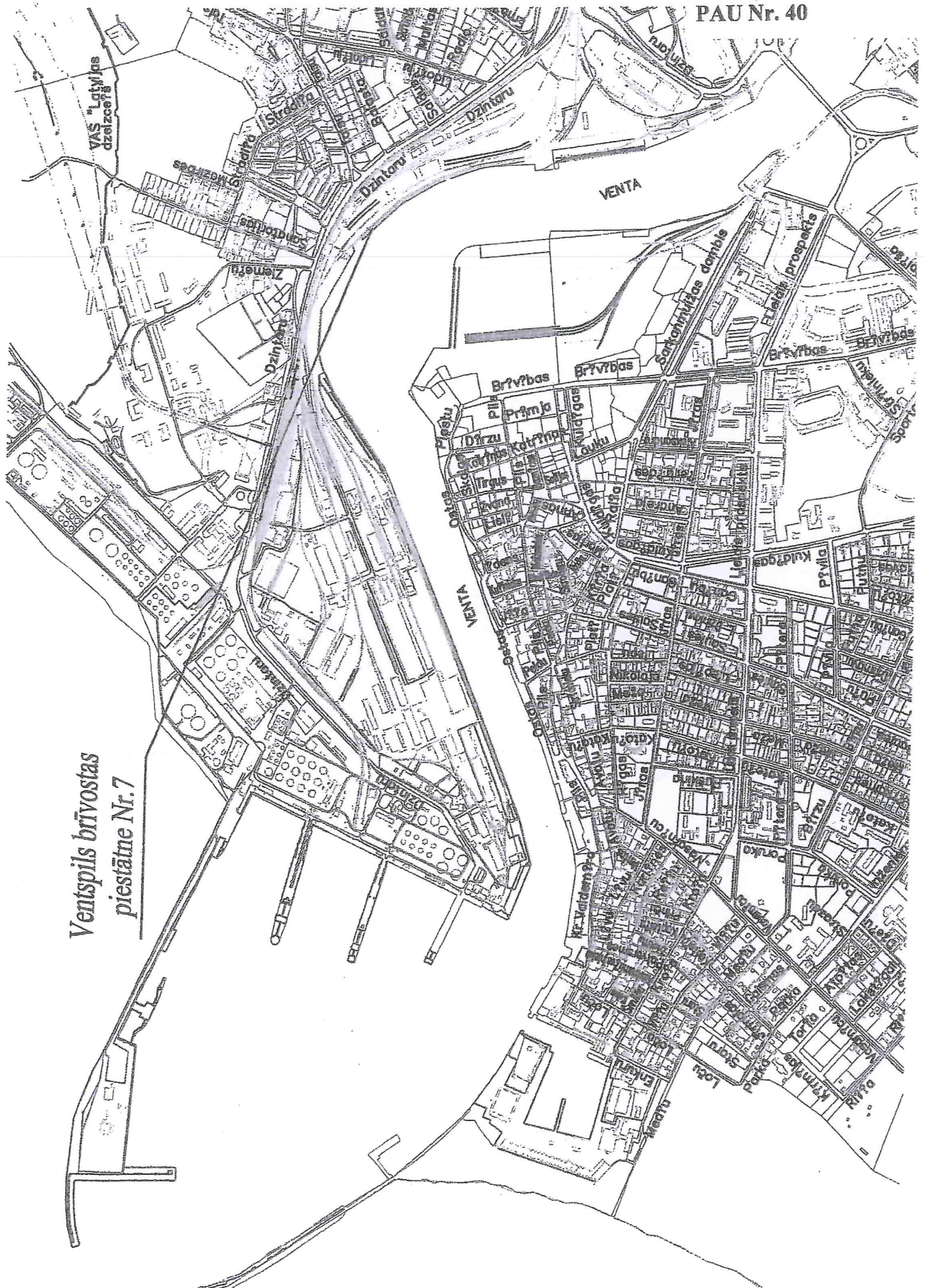
Ventspils brīvostas piestātne Nr.7